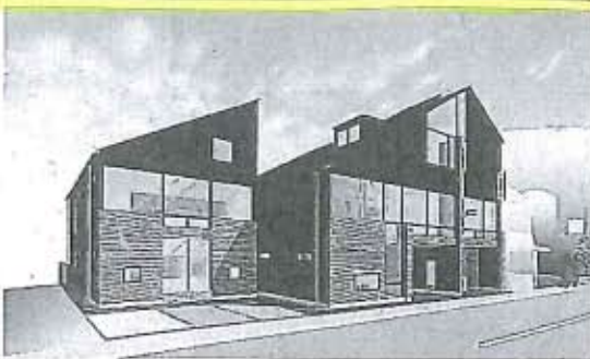
増築後の二九精密機械工業の本社イメージ図

同社は金属や樹脂の微細加工技術を強みにしており、医療機器や分析機器、半導体製造装置などのメーカーを顧客に持つ。取引先の事業拡大で受注が伸びていることに加え、今年が創業100周年にあたるため、大型投資を決断した。