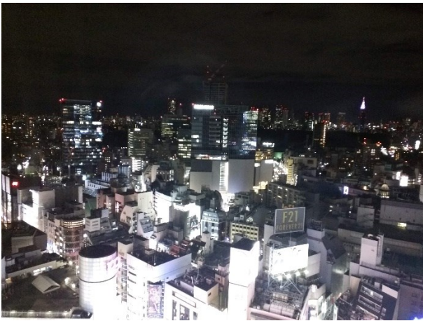
故郷の街 渋谷、25階からの夜景