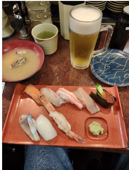
寿司ネタでカニ さすが北陸