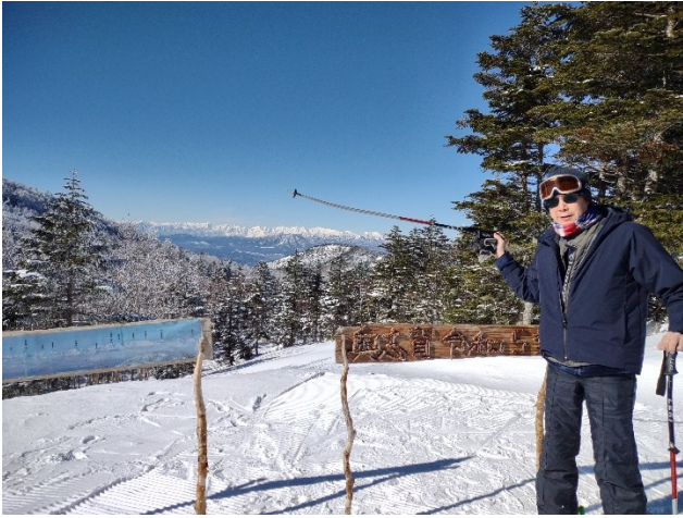
長野県志賀高原 2日だけ休日を頂きました