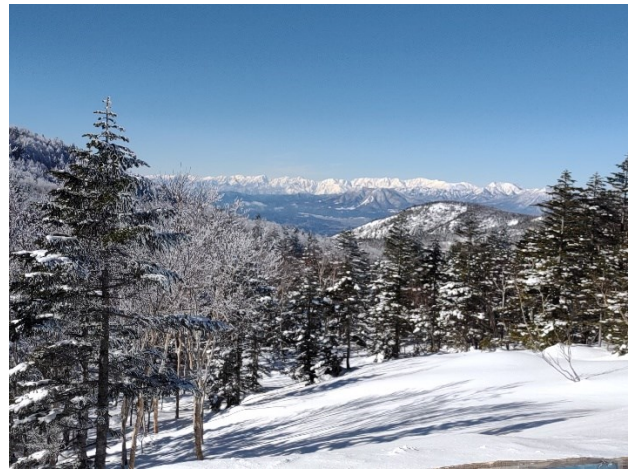
欧州アルプスにも負けない雄大な景色