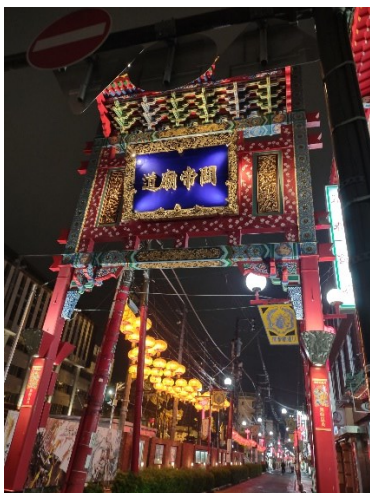
中華街 美味かったです。

以下、日本滞在の思い出をご紹介します。38 年ドイツ在住のほとんどガイジン寸前の日本人は、何にでも感動してしまいます。